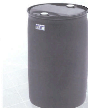
Das F1-Ex-Nanofass von Schütz verfügt dank der Carbon Nanotubes über eine hervorragende elektrische Leitfähigkeit.

könnten Abnehmer künftig beispielsweise auch aus der Farben- und Lackindustrie kommen. Um den Fahrweg der Druckfolgeplatte nicht zu behindern, muss die Formtreue der zylindrischen glattwandigen Verpackung bis zur Entleerung gewährleistet sein. Tatsächlich führen permanente Verformungen von befüllten Stahlgebinden in der Praxis zu immensen Kosten und Verzögerungen für den Anwender. Die Weltneuheit V-Press Drum aus blasgeformtem Polyethylen besteht aus einem flexiblen Kunststoff, der resistent gegenüber bleibenden Verformungen ist. Die